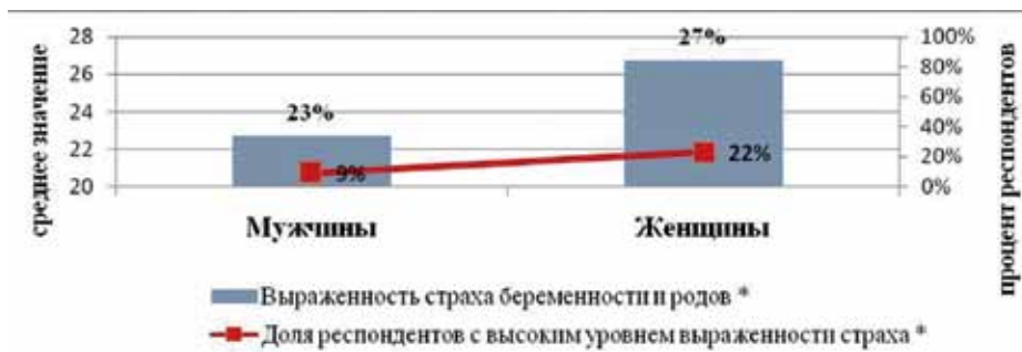
Рис. 1. Средние значения выраженности и интенсивности страха беременности и родов у женщин и мужчин (по Манну – Уитни) ( n_{ж} = 72 ; n_{м} = 69 )

Примечание: левая ось – средние значения выраженности страха беременности и родов у женщин и мужчин (по общей совокупности страхов); правая ось – процент респондентов с высоким уровнем выраженности страха (по общей совокупности страхов); * – различия на уровне значимости p < 0,05 .