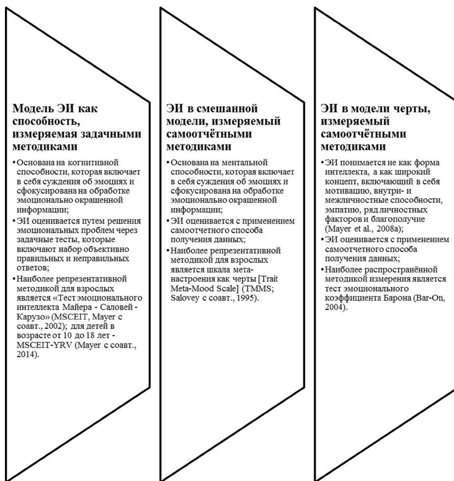
Рис. 1. Модели ЭИ согласно критерию «способ измерения»

тории России, в том числе из-за отсутствия подходящей отечественной методики для измерения, еще меньше, делает разработку методики измерения ЭИ чрезвычайно важной научной задачей.