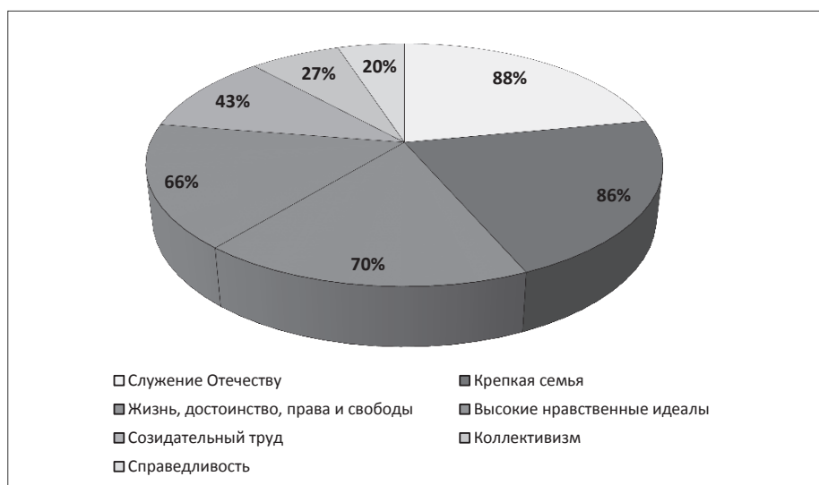
Рис. 1. Результаты ответов респондентов на вопрос «Как вам кажется, какие ценности являются наиболее актуальными для подростка?»

Вторая часть анкетирования включала вопросы, которые дают возможность определить наиболее эффективные формы воспитательной работы по форми-