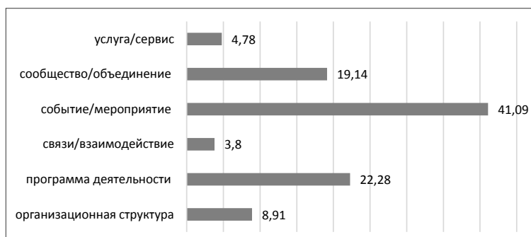
Рис. 2. Субъекты практик воспитательной деятельности и молодежной политики в вузах, %